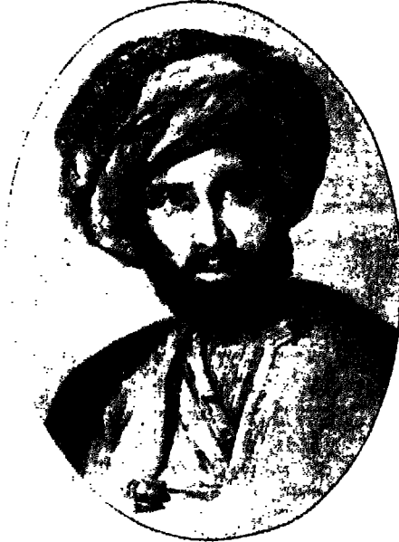
رفاعة الطهطاوى أول مصرى يحرز الوقائع المصرية